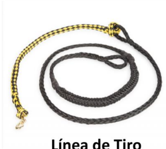
Línea de Tiro

- Están prohibidos los arneses que crucen horizontalmente por delante de las patas delanteras, ya que pueden provocar deformidades e impiden la extensión normal de las patas delanteras.